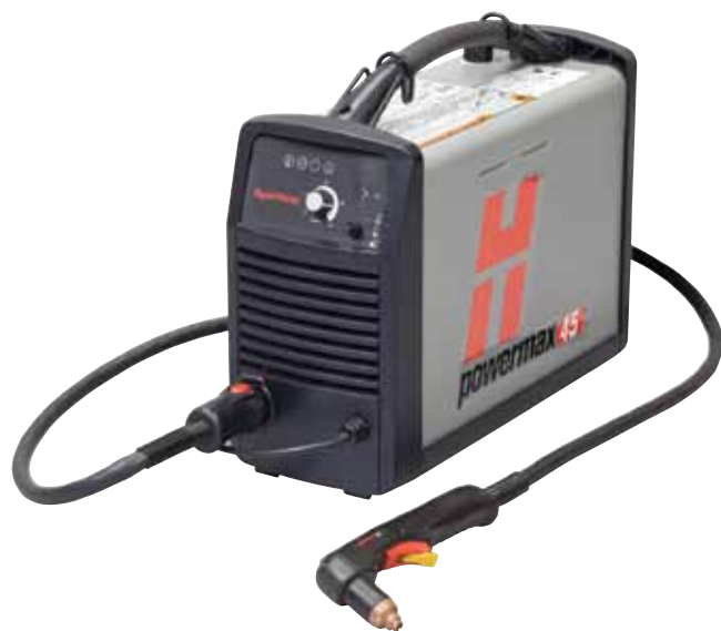
Antorcha manual T45v