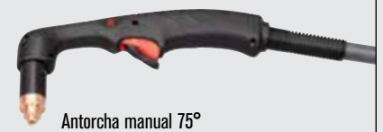
Antorcha manual 75°

(visitar www.hypertherm.com para más opciones de antorchas)