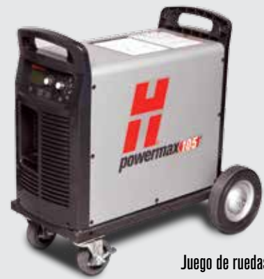
Juego de ruedas