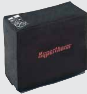
Cubierta contra el polvo para el sistema