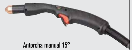
Antorcha manual 15°