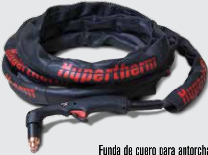
Funda de cuero para antorcha