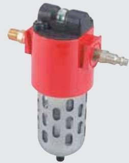
Juego de filtración de aire