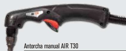
Antorcha manual AIR T30