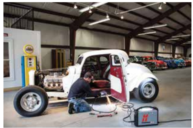
Reparación y modificación de vehículos